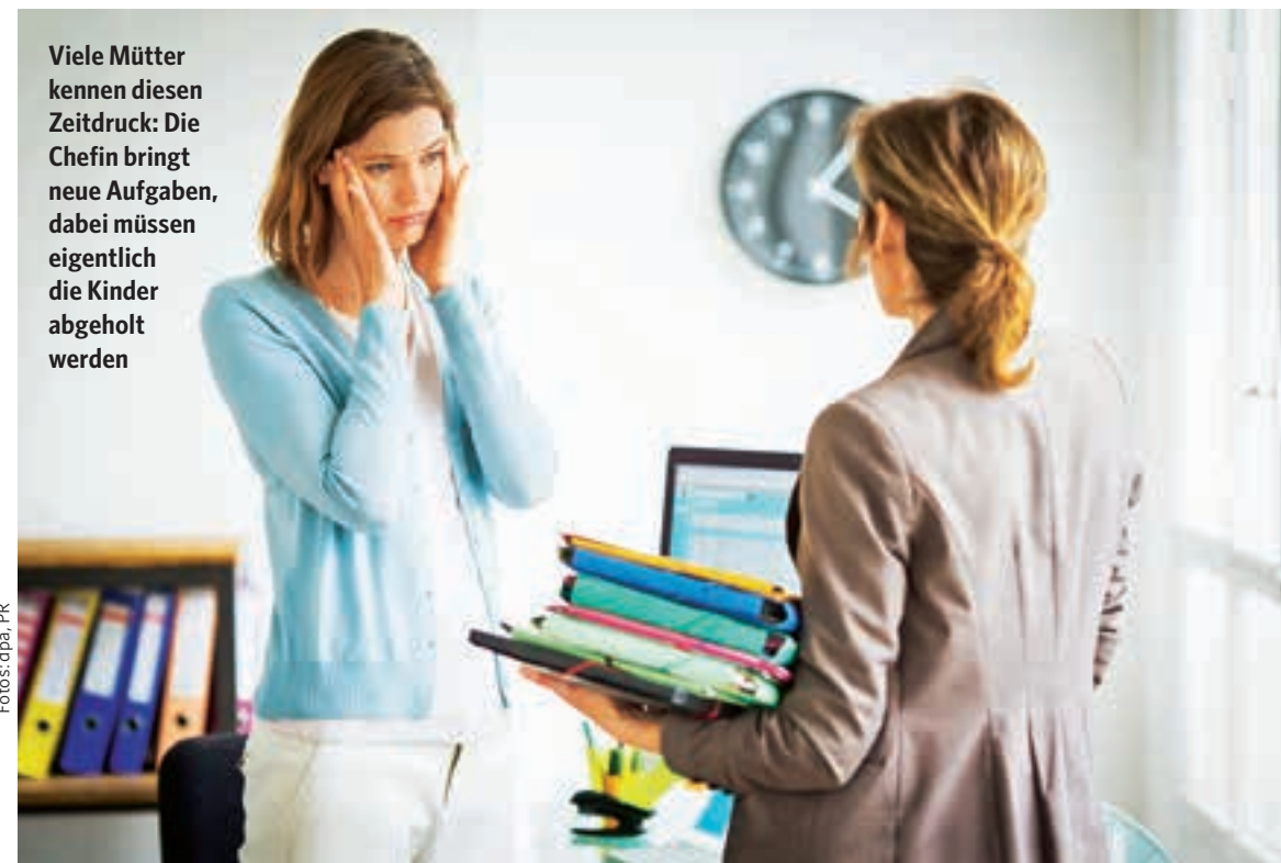
Viele Mütter kennen diesen Zeitdruck: Die Chefin bringt neue Aufgaben, dabei müssen eigentlich die Kinder abgeholt werden